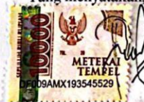
Poly Antes Toboroza